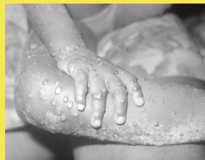
図.サル痘による皮膚病変 Mandell et al. Principles and practice of Infectious Diseases, 9 th Edition. Elsevier